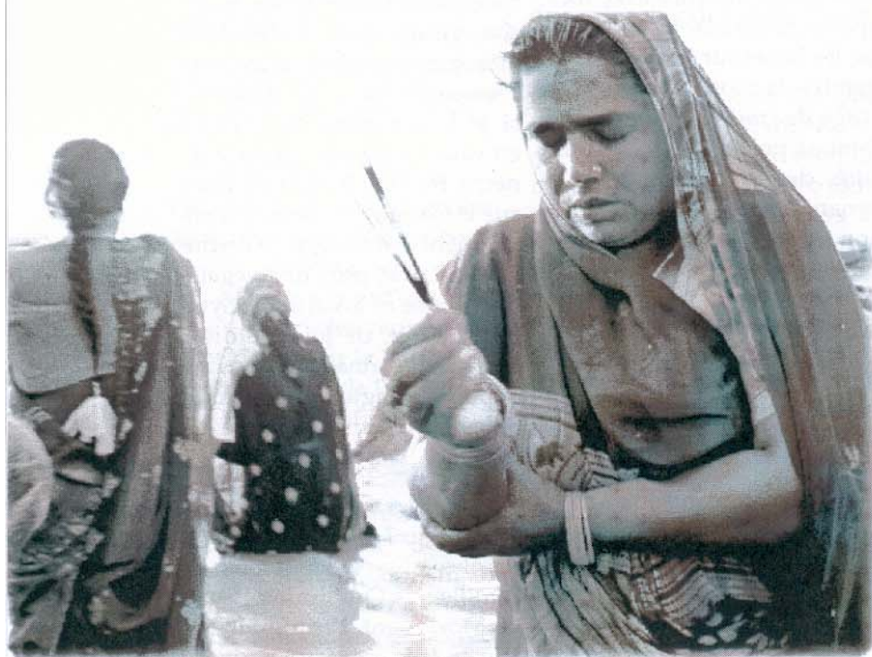
© Catherine van Dyk 2006 – Les ablutions matinales dans le Gange

Nous quittons la ville au petit matin par les ruelles encore sombres et endormies... Je laisse derrière moi Gorakh et les eaux sacrées du fleuve Gangâ, mais j'emène, gravé au plus profond de mon être, leur message tranchant et lumineux... ABANDONNE TES PEURS ET TES SOUFFRANCES, LIBÈRE-TOI, VIS L'AMOUR ET LA JOIE, VIS VRAIMENT ! Le chemin sera long encore, mais j'ai entendu.